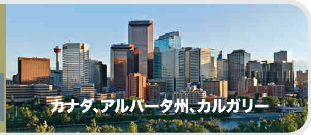
カナダ、アルバータ州、カルガリー