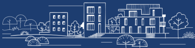
MASTER PLANNED COMMUNITIES

アーバンスターが目指すのは、個性的な住宅、商業施設、教育施設、レクリエーション施設など、自然環境と調和した美しいコミュニティの創造です。